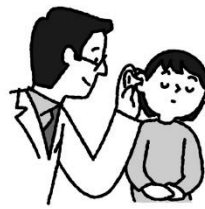
放っておくと治りが悪いので耳鼻科で治療を。