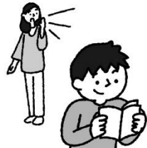
耳の中に液がたまって聞こえが悪くなる。