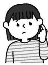
炎症が長く続き、耳漏や聞こえが悪くなる。