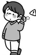
耳かき棒を奥に入れる、歩きながら、などはキケン