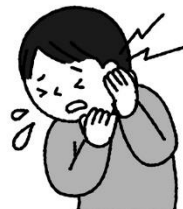
急に炎症が起り耳が痛くなる。