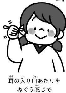
耳の入り口あたりをぬぐう感じで